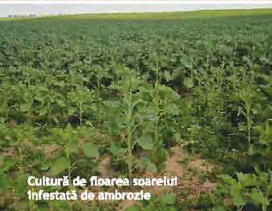
Cultură de floarea soarelui infestată de ambrozie